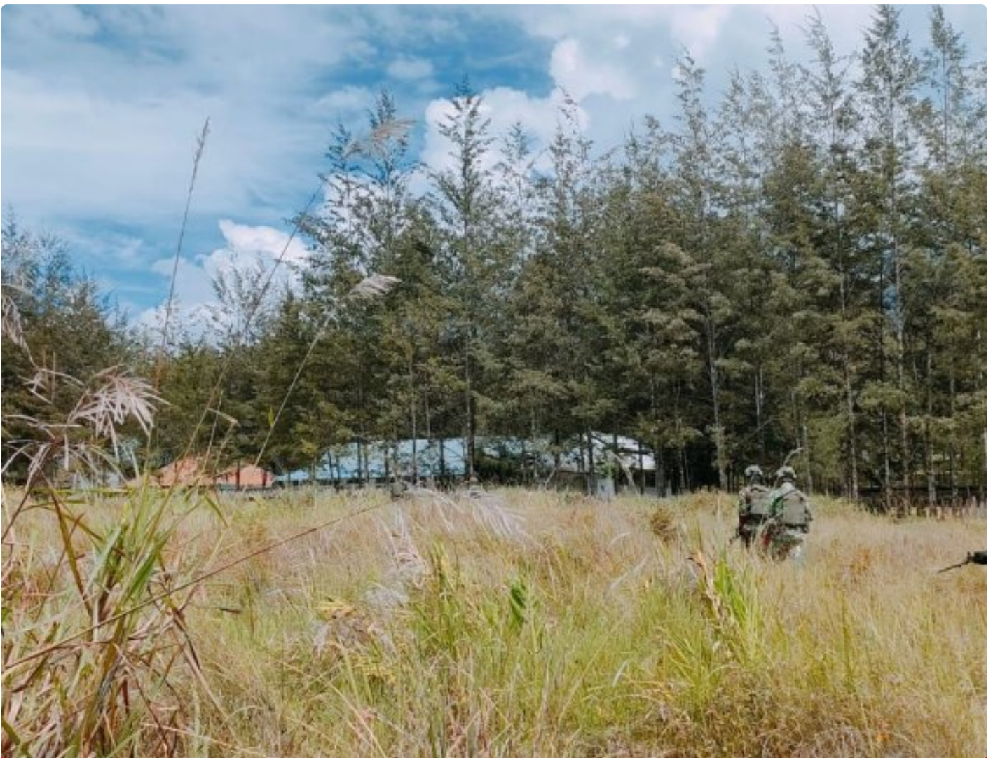
Satgas Yonif 323 Amankan Anggota OPM terduga pelaku tindak Kriminal

Satgas Mobile Yonif 323/Buaya Putih Kostrad berhasil menangkap salah satu